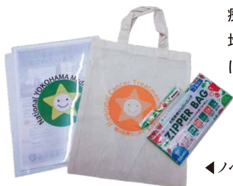
◀ノベルティグッズを配布しました