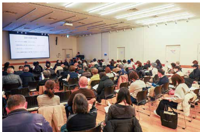
▲真剣に講聴される参加者のみなさま

当院は地域がん診療連携拠点病院として、毎年1～2月頃にがんをテーマとした市民公開医療講座を開催しており、令和8年度も実施予定です。詳細が決まり次第、当院ホームページの「市民公開医療講座」ページ（QRコード参照）にてご案内いたします。今後とも、地域住民のみなさまと接点となる講座やイベントの開催にも積極的に取り組んでいきますので、みなさまのご参加をお待ちしております。