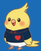
看護学校公式キャラクター 暖(だん)ちゃん