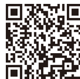
◀市民公開講座の ホームページ