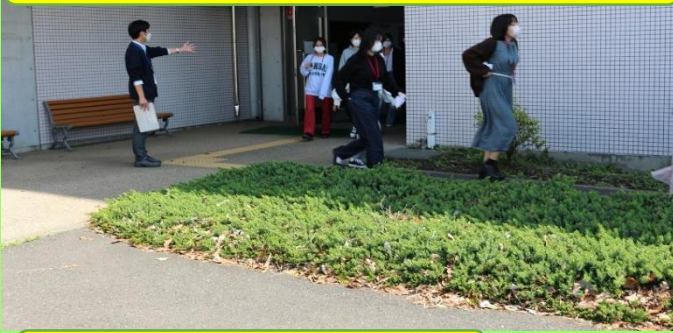
避難指示に従って避難中