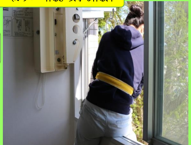
(オリロー体験) 女子も体験中